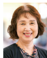
香美市立大宮小学校 英語教育推進教員