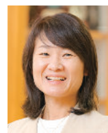
香美市教育委員会 教育振興課学校教育班 指導主事

「子どもは交流会に向けて、英語でどのように言えば自分たちの思いが伝わるのかを考え、当日は自作のみそクッキーについて、留学生に何とか伝えようと頑張っていました。そうした子どもの姿を目のあたりにして、自分