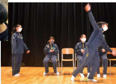
▶写真3 「演劇・コミュニケーション」では、仲間と協働して創作活動をしたり、身体を使って心の動きを表現したりするなど、様々な要素が成長を支え、豊かな人間性を育てている。