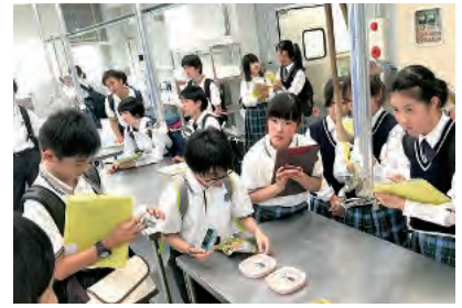
写真1 「未来創造学」では、フィールドワークで地域の鮭の加工会社を訪れ、復興に尽力する社員の思いを聞いた(2019年7月撮影)。

「グローバル・スタディ科」だ。「CLIL(内容言語統合型学習)」*1を活用し、少人数での授業を実施。ネイティブのALTと、地域や世界の課題について議論したり、自分の考えを英語でプレゼンテーションしたりと、多様な活動を通じて、会話や討論、発表などの実践的な英語力を育成する。