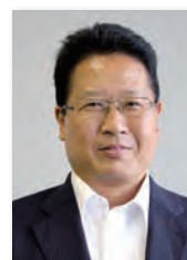
教育推進部教育指導課 統括指導主事

それらソフト面の研究とともに、2016年度までに区立小・中学校30校のすべての普通教室に電子黒板と