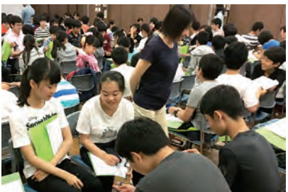
写真1 社会に開かれた問題解決型カリキュラムは、教員が社会で求められるスキルについて理解を深め、それを育成する指導ができていくかを振り返る機会でもある。そこでは、教員が「生徒とともに学ぶ」ことを重視している。

同じく2年次の「クエストエデュケーション」では、テレビ局や建築メーカーといった様々な企業から出される「世界を変える新商品や新サービスを開発する」などの課題と向き合い、グループごとにアイデアを練って提案する。答えが1つではない問いに対して、どのグループも、スキ