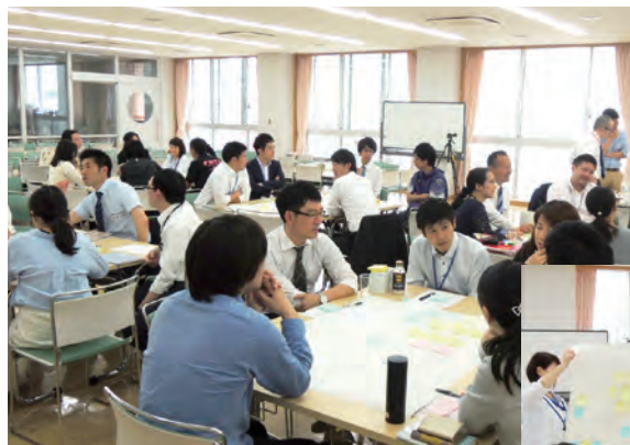
写真2 神経科学研修の第1回には、東京都や神奈川県私立中学校の教員らも参加。まず、教員一人ひとりが指導における課題を挙げていった。そして、それに応じたグループに分かれ、KJ法などを用いて課題を分類し、解決策を話し合った。