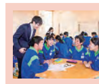
表紙の写真は、羽生市立西中学校でプレゼンテーションコンクールの練習が行われた際の様子です。