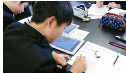
写真2 資料を参照したり、グループで考えを共有したりと、授業の様々な場面でタブレット端末を活用。一方で自分の考えや根拠はワークシートに整理するなど、アナログ教材も重視している。

「生徒が自分の考えを表すのが苦手なのは土地柄だと思っていましたが、考えをまとめて発表する機会を増やせば、どの生徒もしっかり発表でき