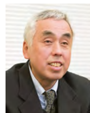
教育部長 谷本隆二 たにもと・りゅうじ

「備前市には大学がなく、子どもたちは大学のイメージがしづらい状況です。休み時間に楽しそうに大学生と話す生徒の姿を見ると、大学生と身近に接し、少し先の未来を想像す