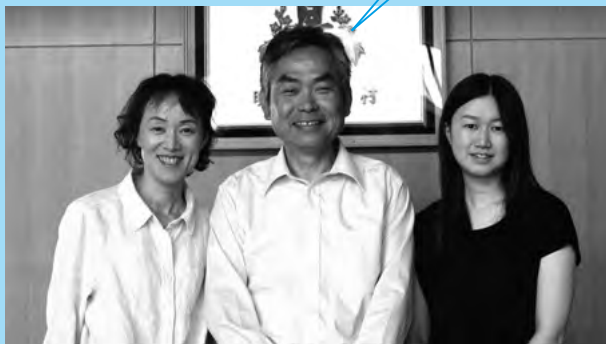
教育委員会の同僚と事務局にて。