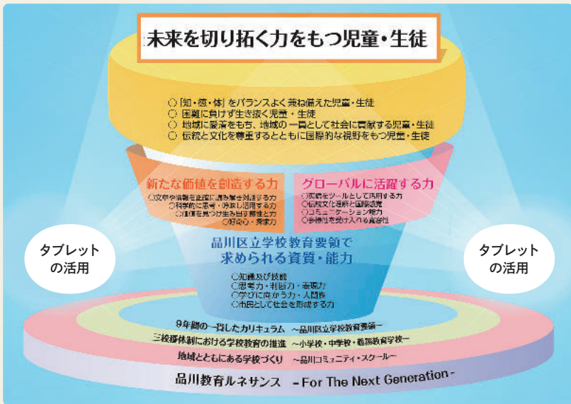
図1 「品川教育ルネサンス」概念図