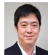
教育委員会 学校教育部指導課 指導主事