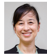
教育委員会 学校教育部指導課 課長