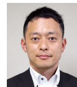
教育委員会 学校教育部指導課 指導主事