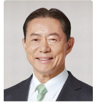
市長 井崎義治 いざき・よしはる

「2005年のつくばエクスプレスの開業に合わせて、沿線の自治体はこぞって大規模な区画整理事業を進めていました。本市がその競争に取り残されれば、少子高齢化や財政悪化が進み、市政が立ち行かなくなります。そこで、多くの人から選ばれるまちづくりを目指して、2003年に マーケティング室 (2004年に マーケティング課 )を設置し、シティセールスを始めました」