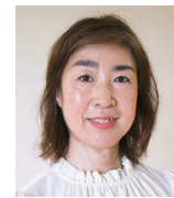
総合政策部マーケティング課 課長

アメリカ・サンフランシスコ州立大学大学院人間環境研究科修士課程を修了後、現地の企業に就職し、都市計画や地域計画に従事。帰国後、株式会社住信基礎研究所、株式会社エース総合研究所を経て、2003年、流山市長に就任。現在6期目。