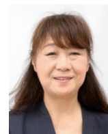
ばれっとルーム担当

ばれっとルームで過ごして「心の充電」をし、教室に戻っていくケースは多い。以前は長期休業明けの「登校しぶり」が不登校につながることもあったが、ばれっとルームで1週間ほど過ごした後、毎日登校するようになったケースがあった。また、感情のコントロールが難しいという理由で利用していた子どもは、教室でイライラしうになると、「ばれっとルームに行ってく