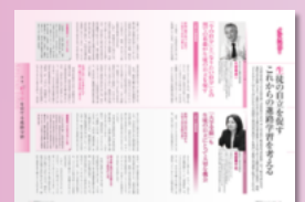
現場の教師が「生徒の自立」をテーマに対談。