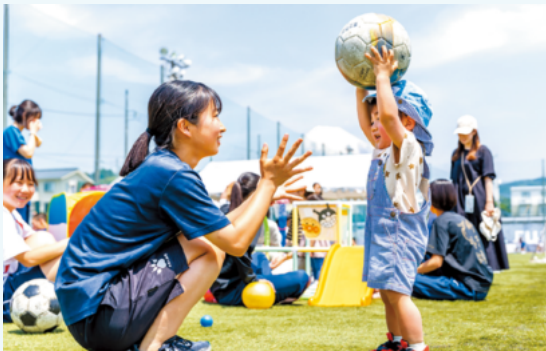
「地域の人との交流を通して、社会で役立つコミュニケーション力を身につけたい」と、取り組みへの期待を語る生徒も多かった。

同校では年2回、校内の人工芝グラウンドにおいて、地域の未就園児とその保護者を対象とした交流事業を行っている。スポーツ探究科の2年生とボランティアの生徒（教員志望者、保育士志望者など）が、人工芝を生かした遊びを考案し、遊具の準備から運営までを行う。生徒たちは、子どもたちがけがをしないよう、細心の注意を払いつつ、子どもたちの様子や反応を見ながら遊びの内容を変更するなど、臨機応変に対応。あちこちで子どもたちのはしゃぐ声が響き、笑顔がはじけていた。