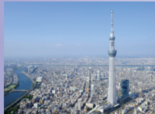
2012年に開業した東京スカイツリー。