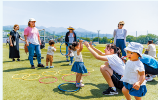
どの遊具でどんな遊びをするのかは、すべて生徒が計画。教師は見守るだけで、まさに生徒が創る地域との交流の場になっていた。