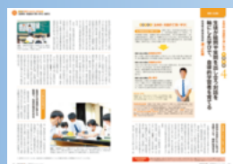
「主体的・対話的で深い学び」を実践例から追究。