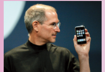
iPhone を発表するスティーブ・ジョブズ氏。