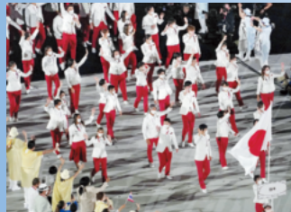
東京五輪の開会式で入場する日本選手。