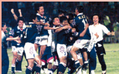
サッカーW杯初出場を決めた日本代表。