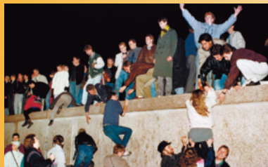
東西冷戦の象徴、「ベルリンの壁」が崩壊。