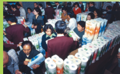
トイレトペーパーの買いだめをする人々。