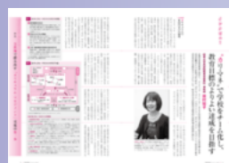
識者による「カリキュラム・マネジメント」の解説。