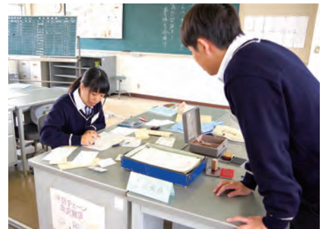
写真 教室に模擬的な市場をつくり、実践的・体験的学習を通じて、経営活動を主体的・合理的に行う能力と態度を育成する。

「インターンシップでの経験や気づきは、クラス内で発表します。発表では、『こんな勉強をしたい』『日常生活でも頑張りたい』といった前向きな言葉が多く聞かれ、そうした生徒の姿からほかの生徒が刺激を受