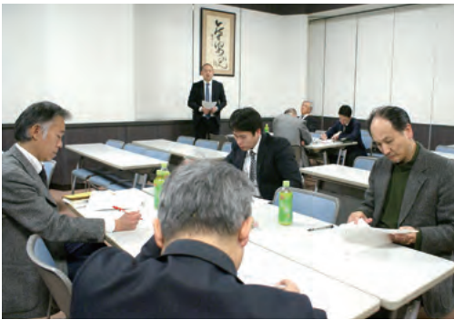
3年間の教育活動を「育てたい生徒像」を踏まえて議論する。その過程で、参加した教師の口からは、「学校全体」「教育活動総体」といった言葉が何度も発せられた。

2月●実施のためのtopoの整理 次年度の教育活動の方針を 全体ですり合わせる 各教育活動について、担当する教師が「育てたい生徒像」を踏まえて、取り組み内容を吟味した結果が、4月以降の方針として発表された。 参加した教師からは、「我々教師が生徒に向き合う時は、すべての教育活動を体系的に捉えておくことが大切なのだ」と改めて実感した。「外部との連携で進める教育活動では、評価の客観性が課題であるなど、引き続き検討すべき事項が明らかになった」などの声が上がった。