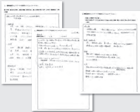
図3 探究のプロセスを確認するワークシート