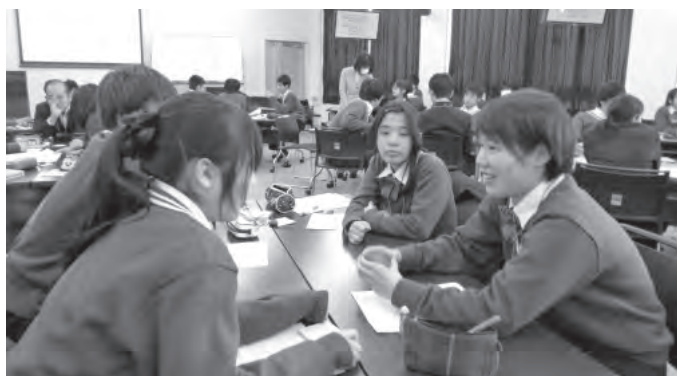
初芝富田林高校では、2日間連続で各回6時間、合計12時間のワークショップが行われた。

4校で実施された未来PJは、同じ高校に通う生徒が集まって行うという点では同じだが、ワークショップ