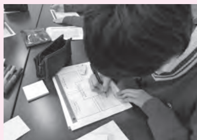
学びの意味、目的を言葉にしている。(写真は、初芝富田林高校)