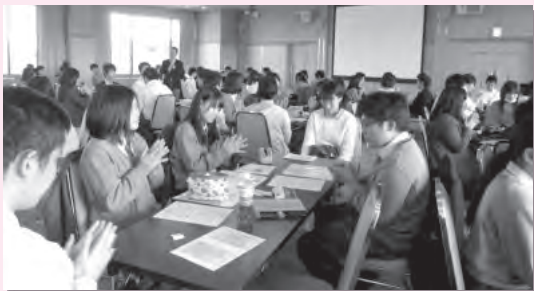
大学生や社会人が自分自身の高校生活を振り返りながら、学びの意味や目的、更に社会の課題について後輩たちと語り合った。（写真上は初芝富田林高校、写真下は慶進中学・高校）