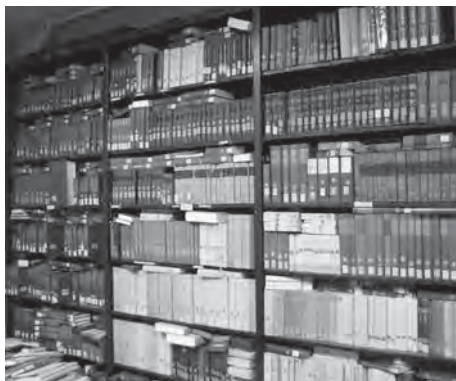
写真 研究室に並ぶ哲学書の数々。原書講読は哲学者の思想にダイレクトに迫る最善の方法である