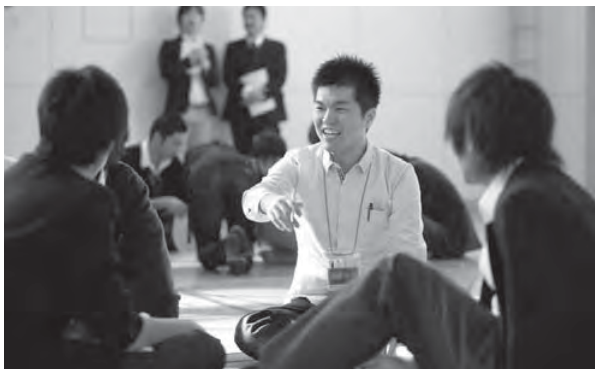
チェックの場面。身近な話題や関心事などからキャストが「高校生の今」を掘り起こす。高校生にとっては自分を見つめ直す機会となる