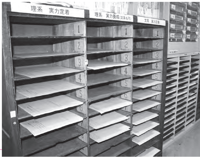
職員室に設置された添削プリントの配布棚。生徒は自分のペースで希望するレベルの問題に取り組む

同校の伝統的な取り組みの「添削棚」は、強力な入試対策であると共に、授業改善にも生かされている。「添削棚」とは各教科の入試対策のプリント指導のことで、国語、数