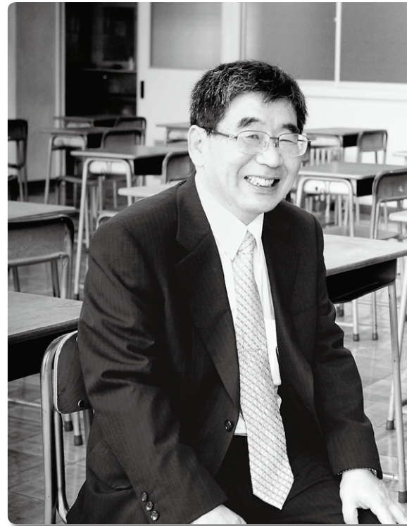
撮影◎石川県立内灘高校にて