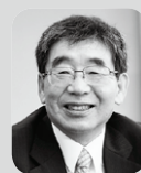
当時の大聖寺高校は、地域の文化にとって文化の

発信地であり、一種のたまり場でした。私はたまたま学校の近所に住んでいたのですが、正月の三日、「学校を開けてください」と生徒数人が家を訪ねてきました。「いったい何をしますつもりか」と聞くと、「勉強する」と言うのです。「ほかの生徒にも声を掛けてしまっているから、ぜひ開けてほしい」と頼んでくるのです。また、普段から進路指導室は生徒の学習室のようになっています。いつまでも生徒が帰らないものだから、進路課の教師も全員彼らに付き合っただけ残っていました。今では考えにくいことかもしれませんが、それが、それだけ学校が頼りにされた地域であり、時代だったのです。富井先生にもずいぶん無理をさせました。