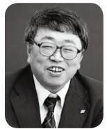
21年前、初任で赴いた石川県立大聖寺高校は、加賀

の美しく、小さな町並みの中に溶け込むように存在する学校でした。生徒たちは、学校をもう一つの我が家のように愛し、教師も家族のように生徒を受けとめていました。