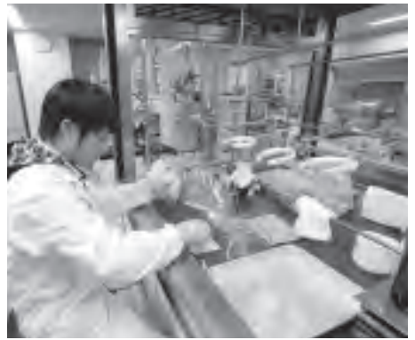
写真 現地で採集した土壌や生物のサンプルを特殊な分析機器を使い、分析する

産業活動によって産出された有害物質は、水温の上昇に伴ってガス化し、気流に乗って地球を巡り、最終的に発生源から遠く離れた極寒の海に集積することが分かったのです。