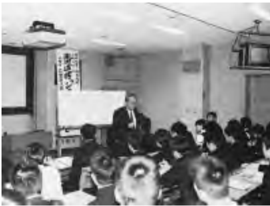
「ジョイントセミナー」では、九州大の教授を招いて、城南高生の前で専門分野に関する基礎的な講義をしてもらい、実験室や研究室を見学する研究室訪問も行った。