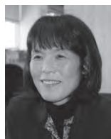
高知市立介良潮見台小学校 研究主任。子どもにも先生にも、誠実に丁寧にかかわる。地域と学校をつなぐことも大切にしたい」