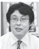
滝宮町立滝宮小学校 研究主任、4学年担任。「自分の心に花を咲かせ、相手の心の花に気づく人になってほしい」