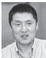
滝宮町立滝宮小学校 教務主任、5学年担任。「日々の何げない習慣やリズムを大切にすることで、子どもが自律・自立する力を育てたい」