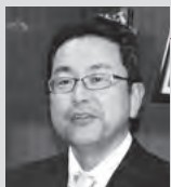
高松市立川東小学校教頭