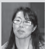
高松市立川東小学校

「子どもも教師も集中して学 習に取り組めるように、常 に環境整備を心掛けている」