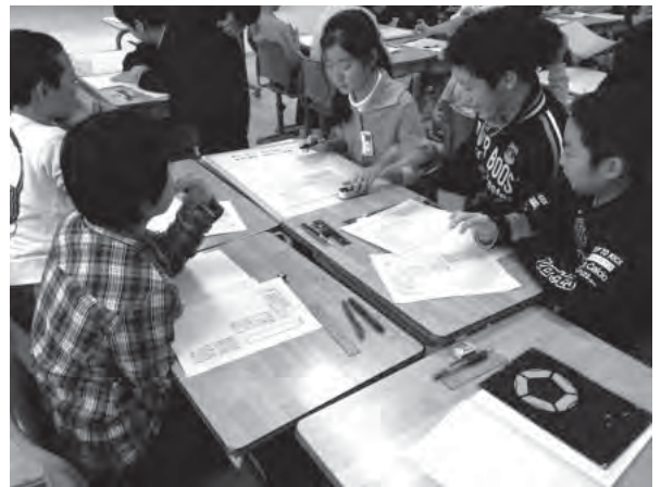
写真 6年生の国語の授業では、新聞記事を読み、見出しをグループで考えた。全ての学年や教科で学び合いを重視しているため、子どもたちは話し合いに慣れており、積極的な姿勢で議論ができていた

ネットなどへの接し方など、生活習慣の指針、授業の準備や受け方の基本ルール、また家庭学習の手引きも作成した。これらは、小学1年生から中学3年生まで、学年を追ってステップアップしていく形式とし、一貫した指導が出来るようにしている。