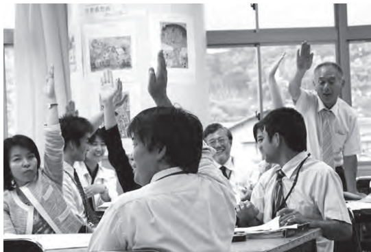
写真1 事後研修会の様子。ポイントを絞って、時間を区切って行うので、活発な意見が交わされる