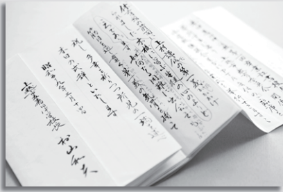
新設後、最初の卒業式で読み上げられた校長式辞（村山校長の直筆）が今も校長室に大切に保管されている

村山校長は、生徒のことも実によく見ていました。何より感心させられたのが、500人ほどの生徒の名