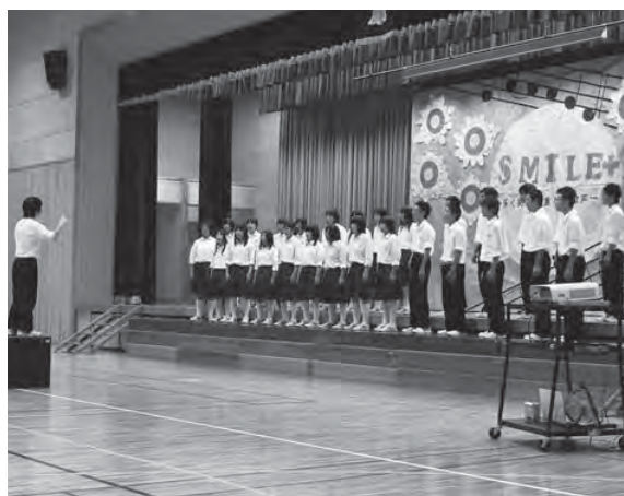
写真2 2010年度、清内路中学校との統合1年目に行った3年生の合唱コンクールの様子。朝と帰りの学活で毎日合唱の練習を続けている成果もあり、生徒の歌声は次第に良くなっている