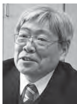
尾花沢市立福原中学校校長