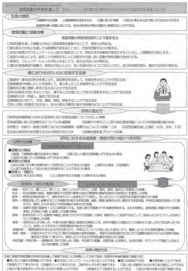
図2 2011年度の研究のねらいと概要

一番下の「成果の検証方法」に書かれている内容は、検証のポイントとして大切なだけではない。「言語活動を取り入れた教育活動を続けると、こんな生徒の変容が見られる」という、同校の目指す生徒像でもある