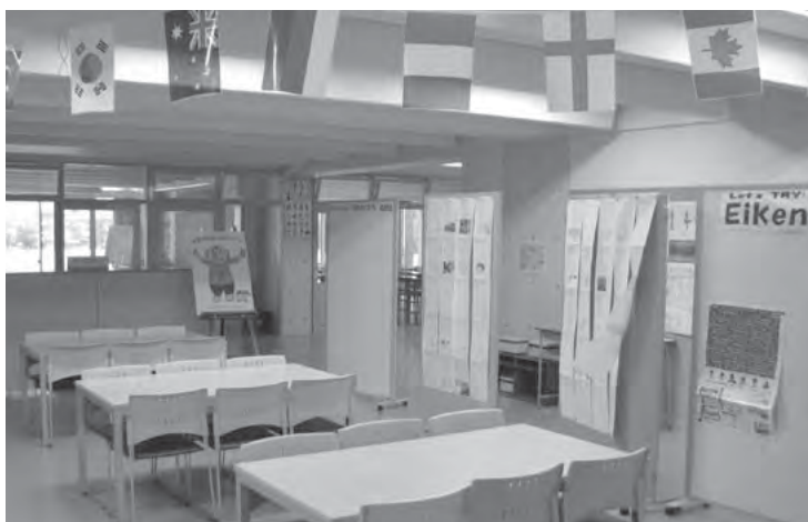
写真 英語の「教科の広場」。廊下からパーテーションで仕切られただけの開放的な つくりになっており、生徒が気軽に勉強や会話ができるスペースも設けられている

主な活動は、教科教室や教科の広場での教 材の展示、教科イベントの企画運営、定期考 査に向けた対策問題の作成などだ。これまで 教科の広場の展示は、その教科が得意な生徒