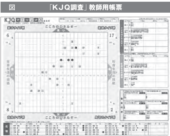
図 「KJQ調査」教師用帳票 「KJQマトリックス」(実務教育出版)の教師用帳票。「こころのエネルギー」と「社会生活の技術」のバランスにより4つの群に分けている *実務教育出版社提供の資料をそのまま掲載