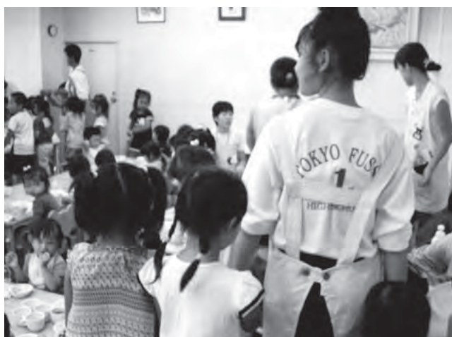
写真2 保育園での職場体験の様子。生徒は小さな子どもたちと一緒に遊び、慕われるうちに、自己肯定感を高めていく

生徒の精神面の成長を促すために、11年度からは2年生で行う職場体験の訪問先を保育園や高齢者福祉施設に限定し、一緒に遊んだりお世話をすることを通して勤労観を育む取り組みを進めている（写真2）。体験先を限定したのは、勤労観を育てるために、活動を通じて自己肯定感も併せて高めたいというね