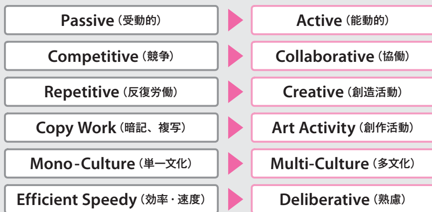
図1 未来を創り出す「生きる力」、学びのイノベーション