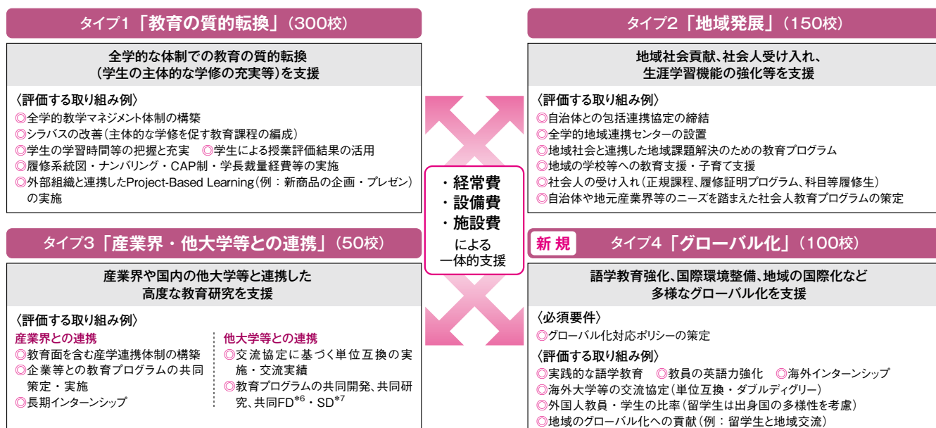
図2 「私立大学等改革総合支援事業」の四つのタイプ

◎在イタリア大使館参事官、内閣参事官、文部科学大臣秘書官、文化庁記念物課長などを経て、平成25年から現職。